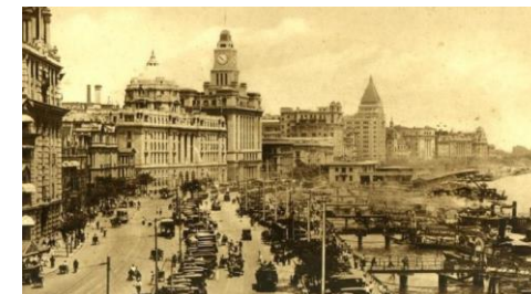
Le bund de Shanghai

Le deuxième Chapitre sera beaucoup plus orientée sur l'Art Déco puisqu'il sera consacré à Shanghai.