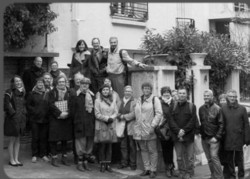
12 décembre – Quartier Montsouris