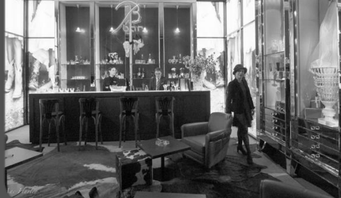
23 janvier 2016 – Visite Galerie Baccarat