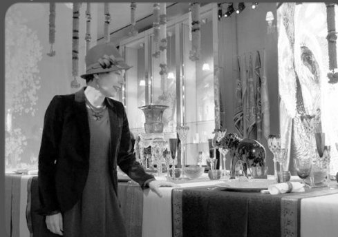
23 janvier 2016 – Visite Galerie Baccarat