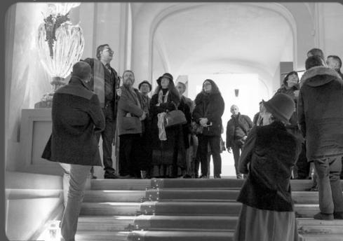
23 janvier 2016 – Visite Galerie Baccarat