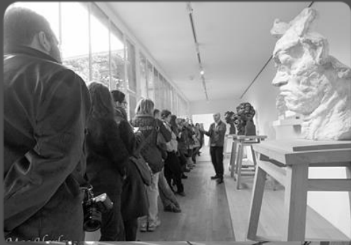
Musée Bourdelle – 20 février 2016