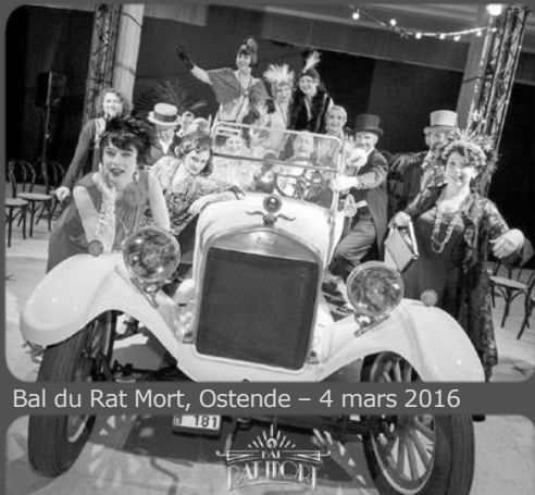
Bal du Rat Mort, Ostende – 4 mars 2016