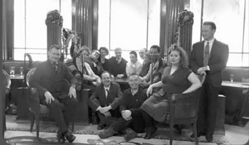
Provinces Opéra – 19 février 2016