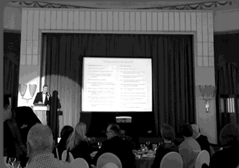
Conférence de Charles Lagrange à Shanghai