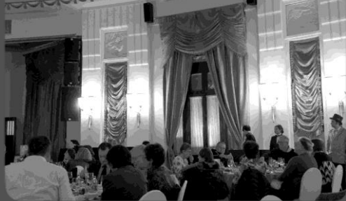
Symposium ICADS à Shanghai – Nov. 2015