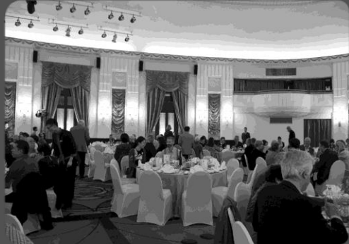
Soirée au cercle français - 3 nov. 2015